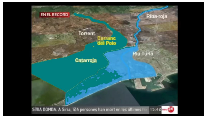
(Captura de pantalla, infografía) ("En el record", riada del 57, "Nou24-RTVV")