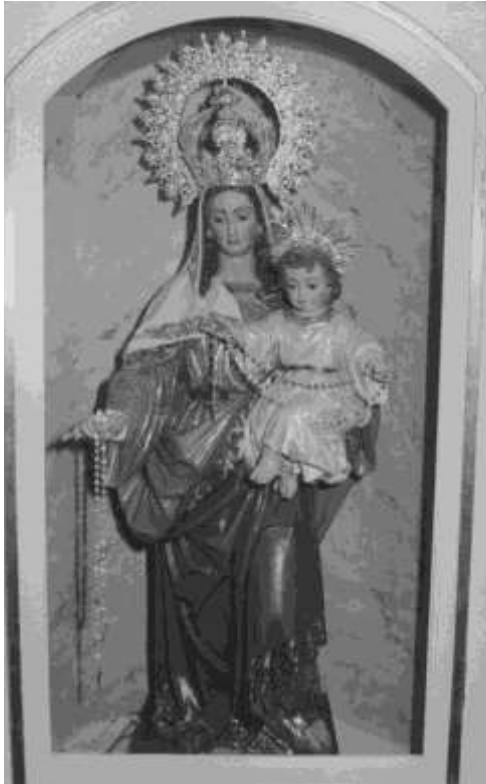
25. VIRGEN DEL ROSARIO

El rosario surgió en la Edad Media. Según una tradición, la Virgen se le apareció en 1208 a santo Domingo de Guzmán y se lo ofreció como arma para combatir a los herejes, si bien, otros consideran que su origen se encuentra en la orden de los cartujos. Así las 150 avemarías representaban y sustituían a los 150 salmos que forman el salterio y era rezado por los monjes que no sabían leer.