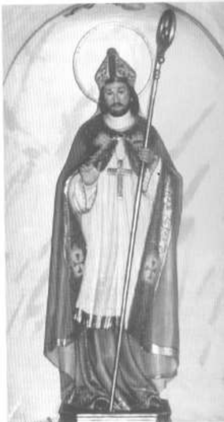
9. SAN BLAS

Este santo armenio era médico de profesión y fue elegido obispo. Cuando estalló la persecución de Diocleciano se escondió en una cueva y visitaba a los cristianos por la noche, al tiempo que curaba a los animales enfermos. Encarcelado, fue capaz de confesar la fe, siendo apaleado brutalmente, mientras él rezaba por sus verdugos. Cuenta la tradición que yendo hacia el martirio encontró a un niño agonizando porque se le había atravesado una espina de pescado en la garganta, rezó y curó al niño. El año 316 le cortaron la cabeza.