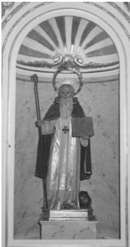
2. SAN ANTONIO, ABAD

Nació en Egipto en el año 251. A los veinte años quedó huérfano de padre y madre, y al entrar en una iglesia escuchó las palabras de Jesús “vende lo que tienes y dalo a los pobres”. Se fue y vendió las 300 hanegadas que había recibido.