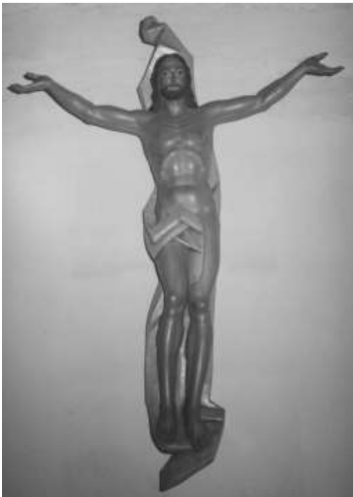
13. CRISTO RESUCITADO (SACRISTÍA)