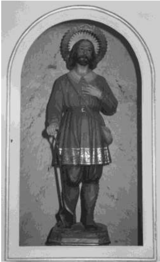
1. SAN ISIDRO, LABRADOR

Hijo de campesinos recibió de su hogar el aprecio por la oración, la misa y el mandamiento del amor.