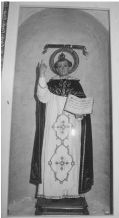
27. SAN VICENTE FERRER

Nació en Valencia en 1350 y con dieciséis años entró en la Orden de Predicadores, donde fue ordenado sacerdote en 1378.