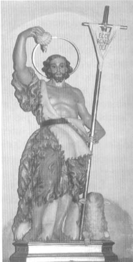
10.- SAN JUAN BAUTISTA

Hijo de padres ancianos, Zacarías e Isabel, quien tras la aparición de un ángel lo concibe en su seno, a pesar de la vejez.