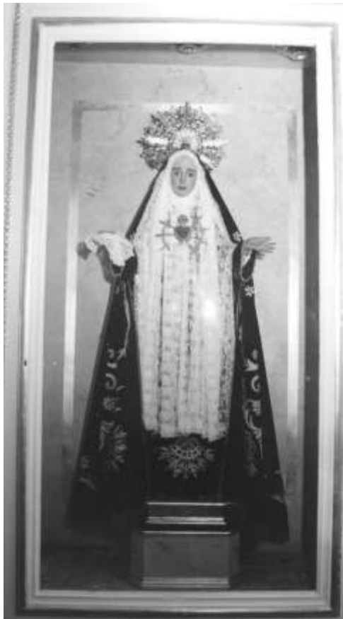
6. VIRGEN DE LOS DOLORES

“Este niño será causa de división: de salvación para unos y de perdición para otros, y por causa de él, una espada de dolor atravesará tu corazón” (Lc 2, 34)