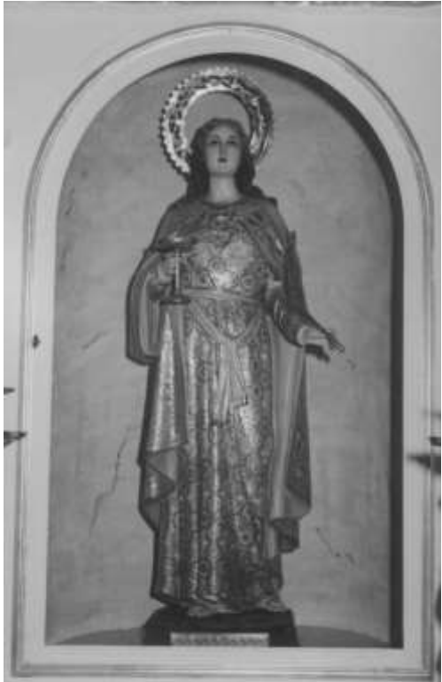
22. SANTA LUCÍA

Nació y murió en Siracusa (Italia); según cuenta una tradición hizo voto de virginidad; siendo ofrecida en matrimonio a un joven pagano, logró convencer a su madre para que desistiese, repartiendo la dote entre los pobres.