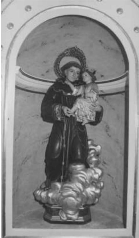
3. SAN ANTONIO, DE PADUA

Nació en Lisboa en 1195 y fue bautizado con el nombre de Fernando. A los quince años entró en el Colegio de los canónigos regulares de san Agustín, entregándose al estudio de la Biblia, la teología, la filosofía y la ciencia de su tiempo.