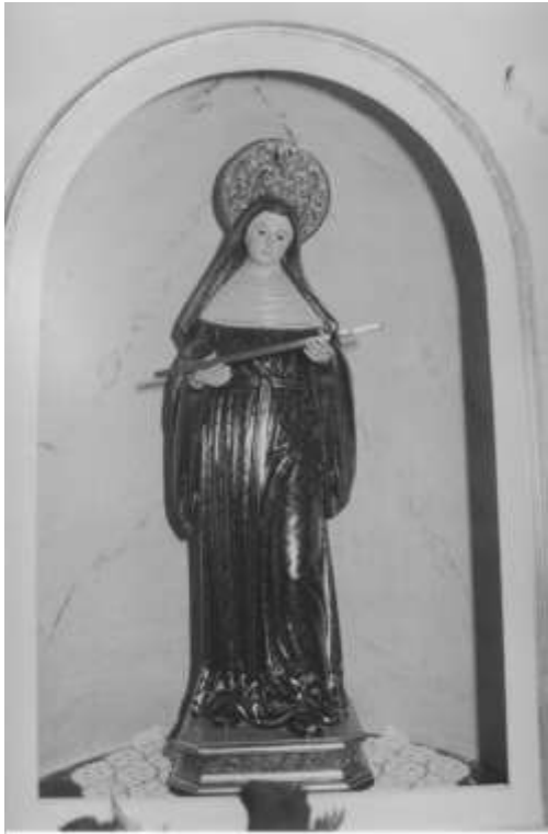
5. SANTA RITA, DE CASIA