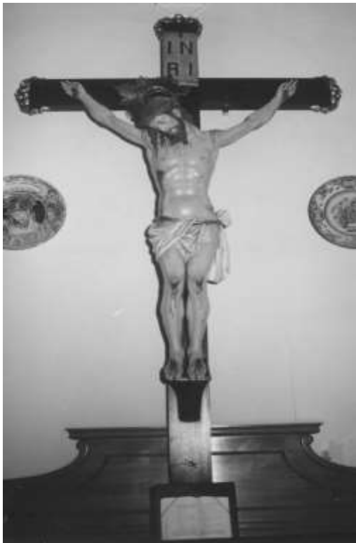
12. CRISTO DE LOS AFLIGIDOS (SACRISTÍA)