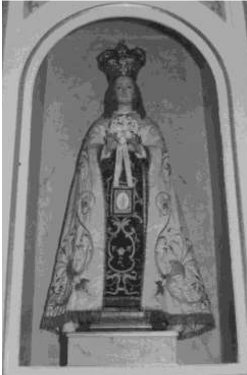
24. VIRGEN DEL CARMEN

En el Monte Carmelo, según la Biblia, se retiraba a rezar el profeta Elías. Aquellas montañas acogieron a monjes que se retiraban para hacer penitencia y orar. Sin embargo todo cambió con la invasión musulmana durante el siglo XI.