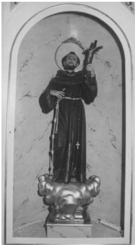
4. SAN FRANCISCO, DE ASÍS

Nació en Asís el 1182. Su padre, le proporcionaba una vida mundana y carente de preocupaciones y sufrimientos. Marchó a combatir contra la ciudad de Perugia y allí cayó prisionero. Tras un año de cautiverio escuchó una voz en su interior “servir al Señor o al siervo”, en la ermita de san Damián escuchó otra voz, procedente del crucifijo: “Francisco, repara mi casa, pues ya ves que está en ruinas”, abandonando el hogar familiar por La Porciúncula, cerca de Asís.