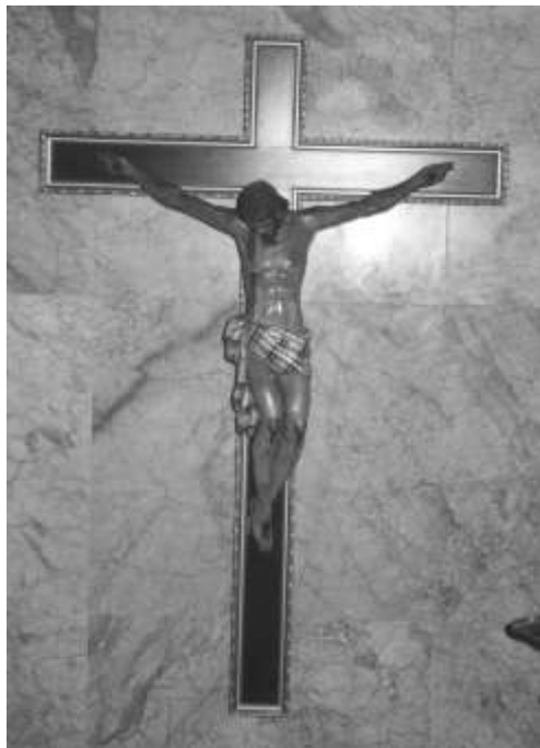
16. CRISTO DE LOS AFLIGIDOS (ALTAR MAYOR)

A principios del siglo XIX vivía en Valencia un muy ilustre canónigo, propietario de la masía de Barrachina, el doctor Fita. Conociendo la fe de los ribarrojenses y el fervor hacia el Divino Maestro y la Santísima Virgen María, decidió regalar al pueblo una bellísima imagen de Cristo crucificado.