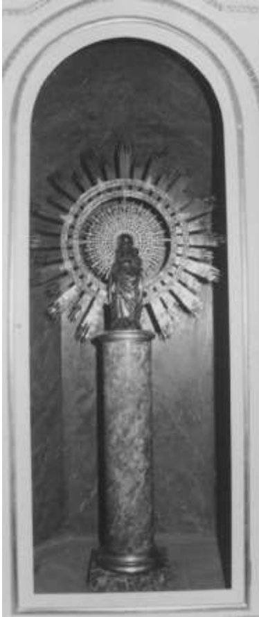
21. VIRGEN DEL PILAR

La tradición se encuentra tal como aparece en unos documentos del siglo XIII que se conservan en la catedral de Zaragoza. En ellos se afirma que fue al apóstol Santiago a quien en el año 40 se le apareció la Virgen María sobre un pilar a orillas del Ebro, animándole ante las dificultades que encontraba para evangelizar.