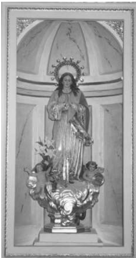
20. LA INMACULADA

Esta devoción parece ser que fue traída por los cruzados ingleses procedentes de Oriente a mediados del siglo XI. Se desarrolló gracias a los franciscanos y al Beato Duns Scoto (1263).