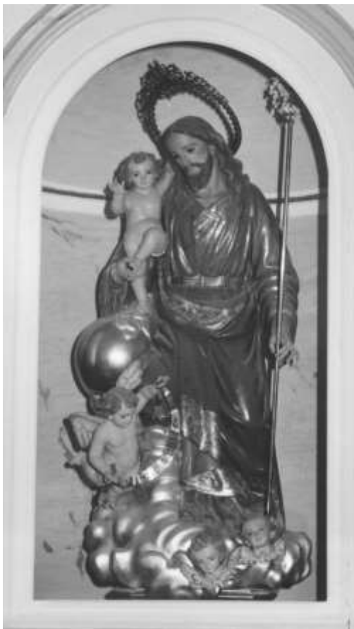
19. SAN JOSÉ

Considerado el santo del silencio, su vida la conocemos por los evangelios. Según Mateo y Lucas, José se encontraba desposado con María cuando ella recibió el anuncio de su concepción. Como era justo y bueno no quiso denunciarla y decidió repudiarla en secreto, pero apenas había tomado esta decisión cuando se le apareció en sueños un ángel que le invitó a tomarla por esposa.