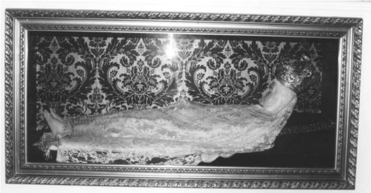
14.- NUESTRA SEÑORA (IMAGEN YACENTE)