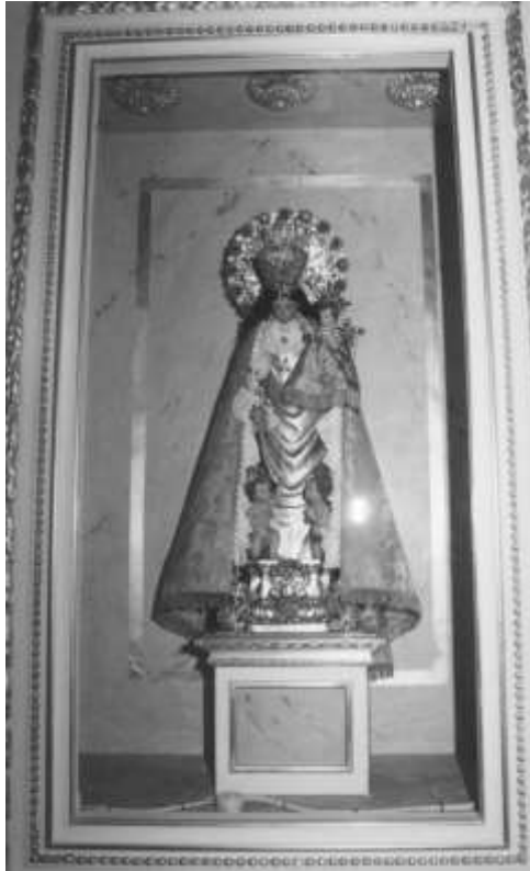
23. N S DE LOS DESAMPARADOS

Fue en 1409 cuando fray Juan Gilabert Jofré, religioso mercedario, observó en su trayecto hacia la Catedral de Valencia como unos jóvenes maltrataban e insultaban a un pobre loco. Tras salvar al pobre hombre, siguió su camino y en el sermón en la Seo hizo una llamada en favor de “els ignocents” que iban por las calles de la ciudad, despreciados por todos.