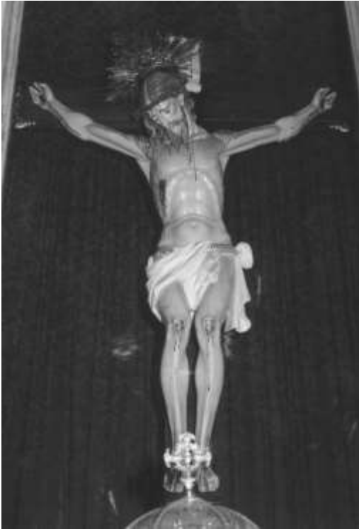
18. CRISTO DE LOS AFLIGIDOS (SAGRARIO)

La imagen recorrió las calles del pueblo, mientras la comitiva iba entonando la Letanía de los Santos. A la puerta de cada casa, se detenía la procesión para que el Santísimo Cristo pudiera observar a los suyos compartiendo aquellos sufrimientos que él mismo padeció. Fue su mirada la que consoló a las familias y alivió a los enfermos, desapareciendo paulatinamente la epidemia de la población.