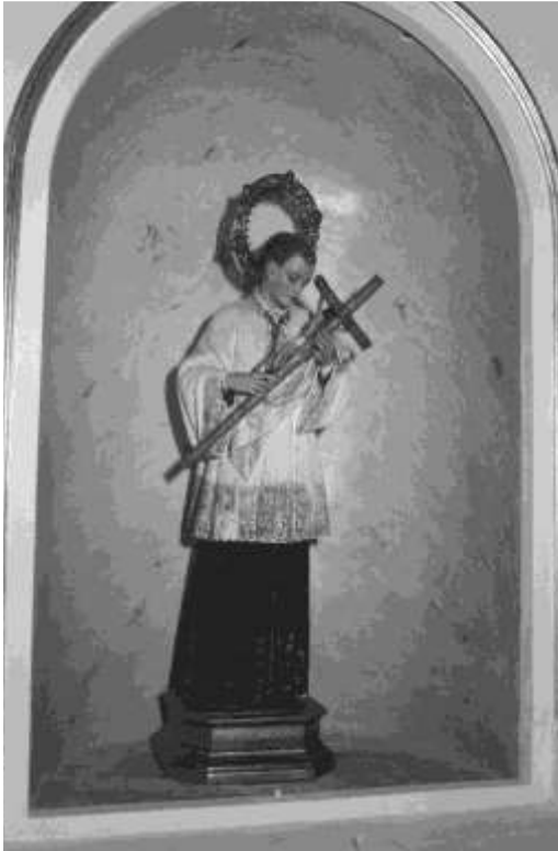
26. SAN LUIS GONZAGA

Nació el 1568 en Castiglione, Italia. Hijo del Marques de Gonzaga. Convertido en paje de honor en Florencia y viendo la corrupción de la corte y con tan sólo diez años hizo voto de virginidad.