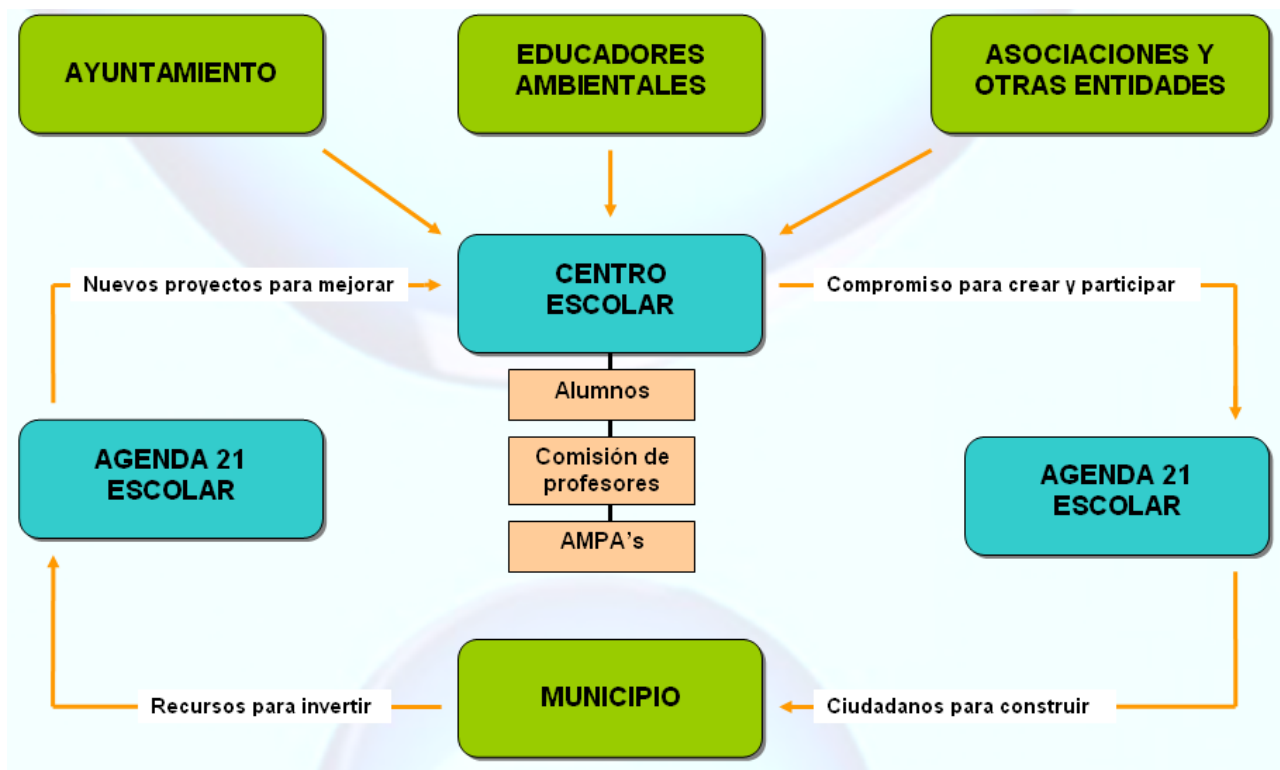
Fig. 1. Entidades colaboradoras en un Programa Agenda 21 Escolar

La Agenda 21 Escolar es una herramienta de Desarrollo Sostenible, gracias a la cual los niños pueden trabajar conjuntamente en los problemas ambientales del colegio o municipio, conociéndolos, valorándolos y, en definitiva, participando activamente en la resolución de los mismos. Estos programas se instituyen en los centros escolares por medio de comisiones de alumnos y profesores, y el apoyo constante de educadores ambientales para el desarrollo de las diferentes fases del programa. De esta forma, las Agendas 21 Escolares se integran con facilidad dentro del proyecto curricular del centro, y pueden desarrollarse a lo largo de varias ediciones enriqueciéndose con nuevas iniciativas, nuevos recursos, o la cooperación de otros colectivos y/o entidades locales.