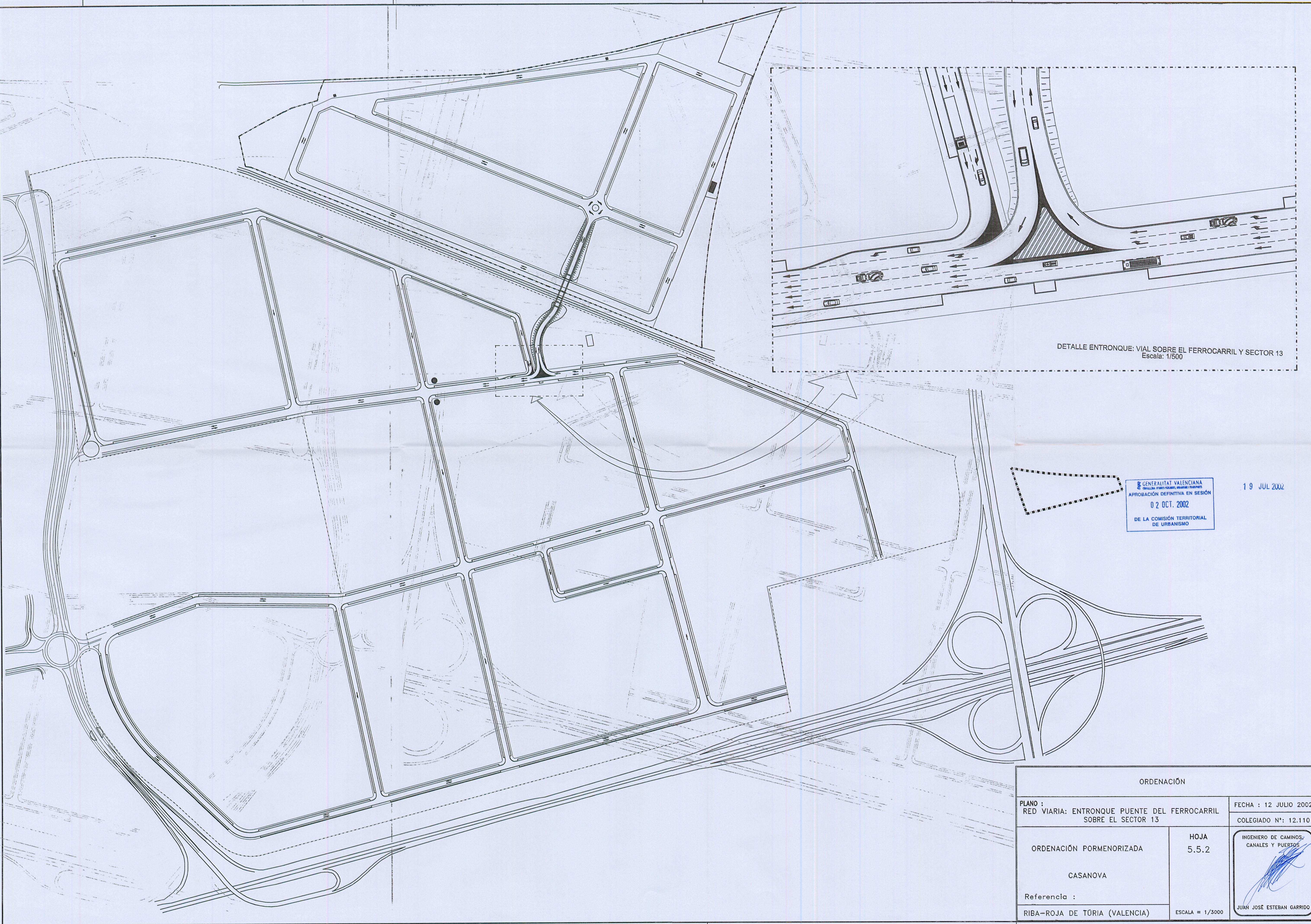
DETALLE ENTRONQUE: VIAL SOBRE EL FERROCARRIL Y SECTOR 13 Escala: 1/500